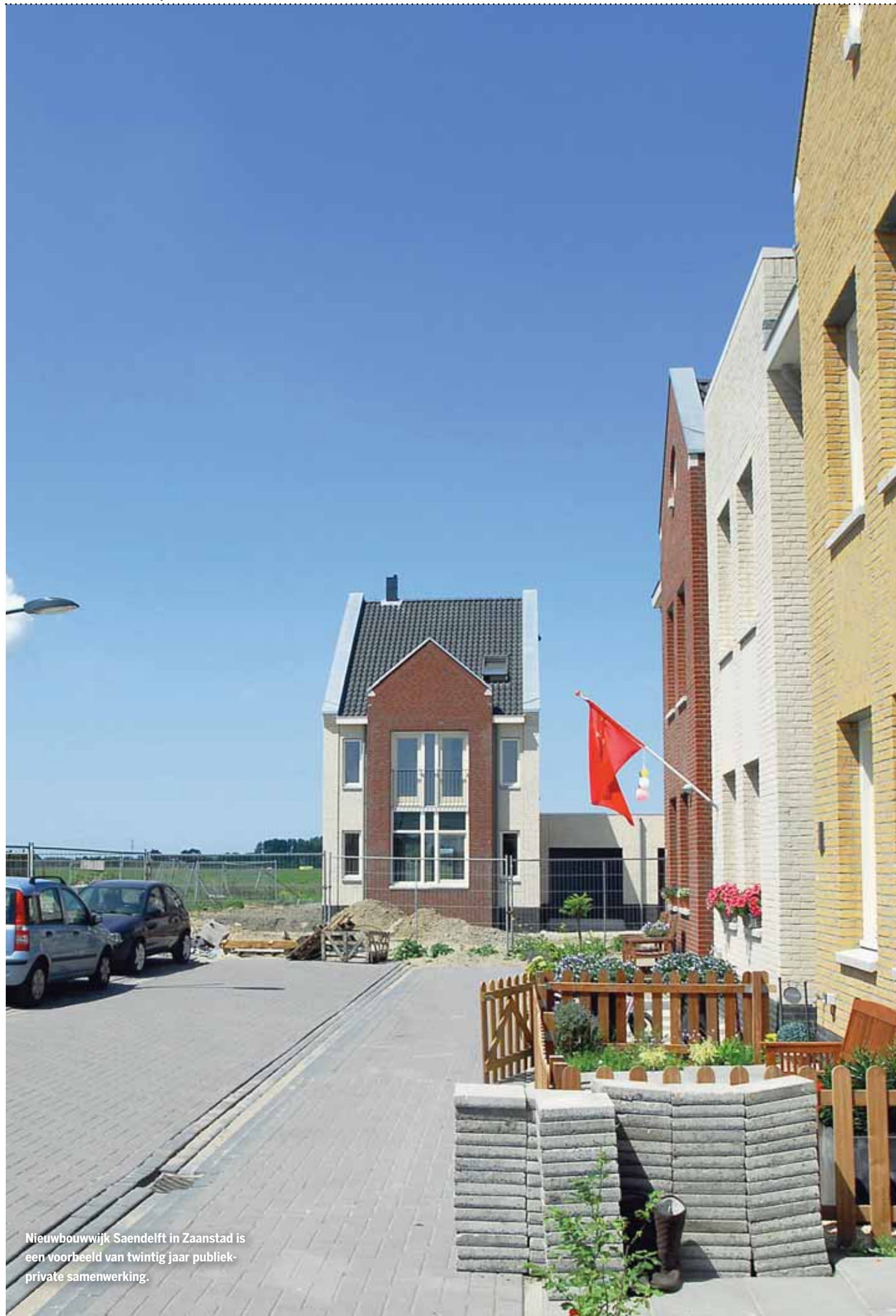
Nieuwbouwwijk Saendelft in Zaanstad is een voorbeeld van twintig jaar publiek-private samenwerking.